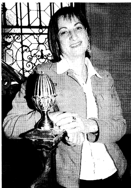
Loretta Napoleoni, autora del libro «Yihad». / CARLOS HOYS.

economía del terror comienza con el terrorismo patrocinado en la Guerra Fría por Estados Unidos y la Unión Soviética. Además, el origen de Al-Qaida está en EE UU. Ese ejército musulmán fue creado y financiado por la CIA y Arabia Saudí. Es un monstruo que nosotros hemos creado. - ¿Podrían prescindir los países occidentales de esa inyección de un billón y medio de dólares procedente del terrorismo? - La interdependencia entre los dos sistemas ha progresado tanto que es difícil cortar los puentes. Las consecuencias de la desaparición de este dinero serían muy negativas, ya que es un elemento muy importante para la liquidez de la economía occidental. - Se ha hablado mucho de que los terroristas de Al-Qaida sacaron provecho del 11-S en los mercados